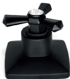
C37CCL16 Acabamento para registro trizeta de metal com cristal 1/2, 3/4 e 1 padrão DECA.