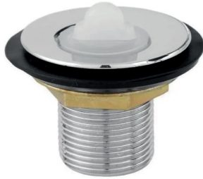
VL1600 Válvula para pia curta