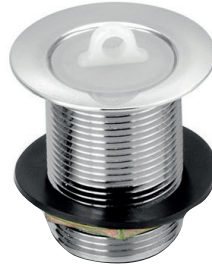
VL1605 Válvula para tanque