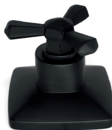
C37CL16 Acabamento para registro trizeta de metal 1/2, 3/4 e 1 padrão DECA.