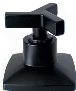
C26CL16 Acabamento para registro trizeta de metal 1/2, 3/4 e 1 padrão DECA.