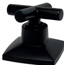
C38CL16 Acabamento para registro cruzeta de metal 1/2, 3/4 e 1 padrão DECA.