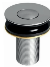
VL1603CI Válvula para lavatório com click interno