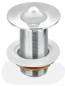
VL1603 Válvula para lavatório sem ladrão