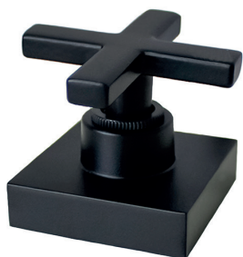
C29CG16 Acabamento para registro cruzeta de metal 1/2, 3/4 e 1 padrão DECA.

Flexibilidade é ser livre para escolher, a cor que mais combina com seu ambiente.