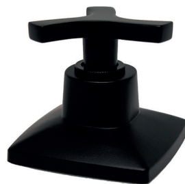
C34CL16 Acabamento para registro trizeta de metal 1/2, 3/4 e 1 padrão DECA.