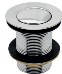
VL1605CI Válvula para tanque com click interno