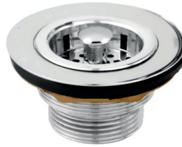
VL1625 Válvula para pia americana