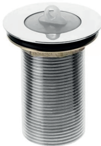
VL1605L Válvula para tanque longa