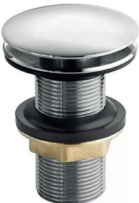
VL1603CE Válvula para lavatório com click